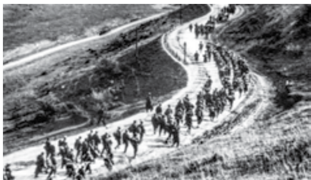
Борците на 15-от македонски корпус, кон позициите на Фрушка Гора

тоа и да ги ослободат градовите: Товарник, Винковци, Илинце, Шид, Шидски Бановци и другите помали места. Жестоките борби продолжиле непрекинато до средината на мај 1945 година. Во текот на овие борби, македонските единици учествувале и во ослободувањето на градовите: Гаково, Врпоље и Славонска Пожега. По успешно изведената офанзива, на 8 мај 1945, единиците на 42-та македонска дивизија влегле во Сесвете, во предградието на Загреб. Истиот ден, биле ослободени Загреб и Љубљана.