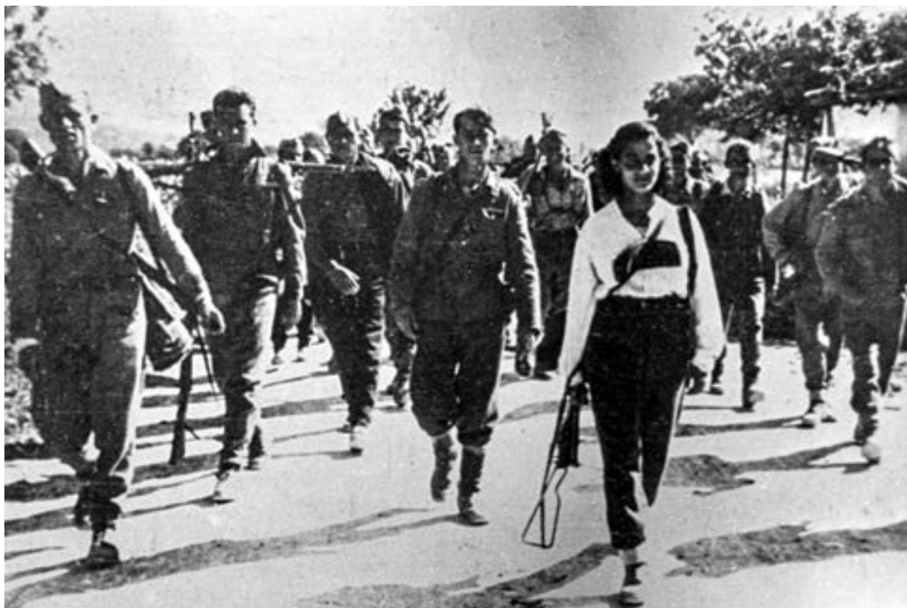
Борците на Третата македонска ударна бригада, 42-та дивизија, се враќаат по завршените операции на Сремскиот фронт. Мај 1945 година