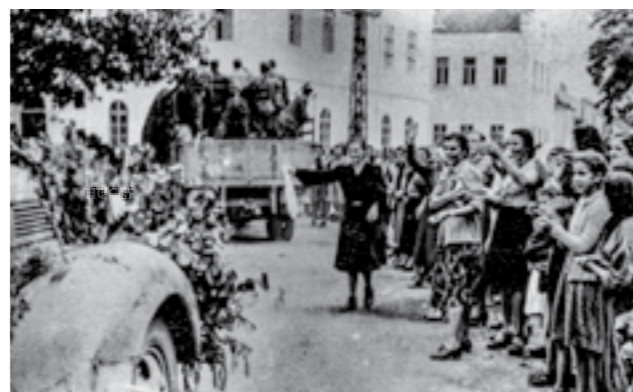
Дочек на македонските единици во Бјелина, Источна Босна, на враќање од Сремскиот фронт. Јуни 1945