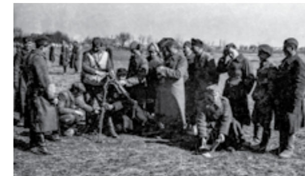
Борци на 15-от македонски корпус детално се запознаваат со конструкцијата на минофрлачот. Февруари 1945