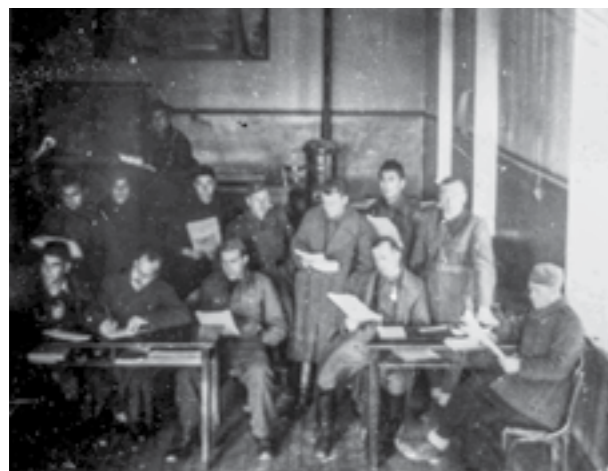
Офицерски курс во Скопје