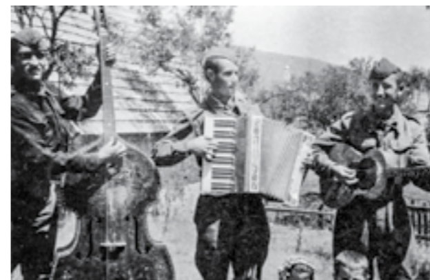
Борци на 42-та дивизија се разонодуваат во слободните часови во Босна