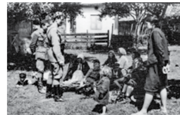
Борци на 48-та дивизија со група селани во Босна