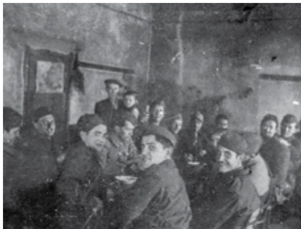
Банкет во Скопје пред заминувањето на македонските единици на Сремскиот фронт

офанзива на фронтите, со која требало да ѝ се зададе завршниот удар на нацистичка Германија и на нејзините сојузници. Од успехот на оваа операција зависела победата над фашизмот, а со тоа и крајот на војната. Во такви околности, секаква друга ориентација и одлука на македонското раководство и воените сили однапред била осудена на пропаст и директно би ги загрозила придобивките од национално-ослободителната и антифашистичка војна во Македонија.