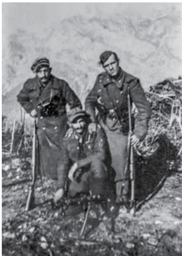
Ранети борци на Првата македонска бригада на Сремскиот фронт