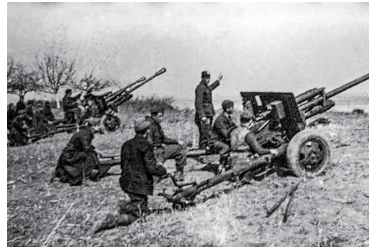
Воени вежби на борците од 42-та дивизија кај Земун, пред пробојот на Сремскиот фронт. Февруари - март 1945