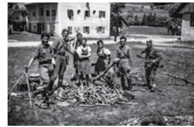
Борци на артилериската бригада, сликани во Словенија. Мај 1945