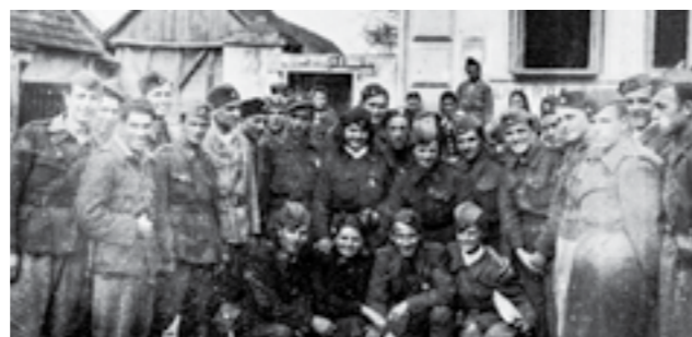
Борци на Првата бригада, 48 дивизија, меѓу кои се и членови на Агитпроп. Април 1945