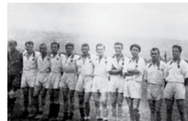
Фудбалскиот тим на 42-та дивизија во Бихаќ. Мај 1945 година