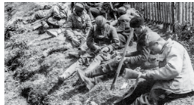
Борците на 48-та дивизија го чистат своето оружје на Сремскиот фронт

тоа и да ги ослободат градовите: Товарник, Винковци, Илинце, Шид, Шидски Бановци и другите помали места. Жестоките борби продолжиле непрекинато до средината на мај 1945 година. Во текот на овие борби, македонските единици учествувале и во ослободувањето на градовите: Гаково, Врпоље и Славонска Пожега. По успешно изведената офанзива, на 8 мај 1945, единиците на 42-та македонска дивизија влегле во Сесвете, во предградието на Загреб. Истиот ден, биле ослободени Загреб и Љубљана.