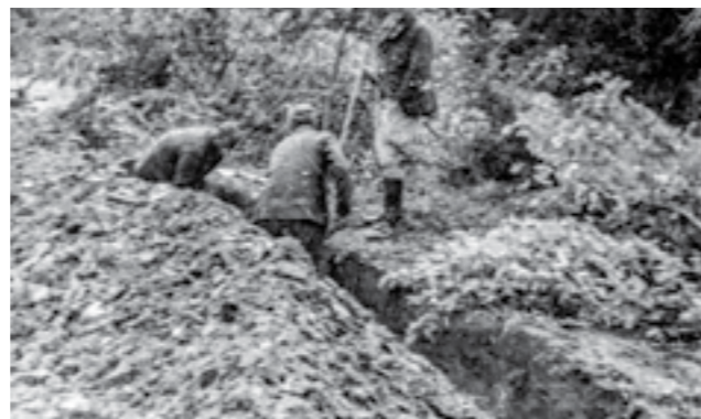
Копане ровови на позициите на Сремскиот фронт. Април 1945 година