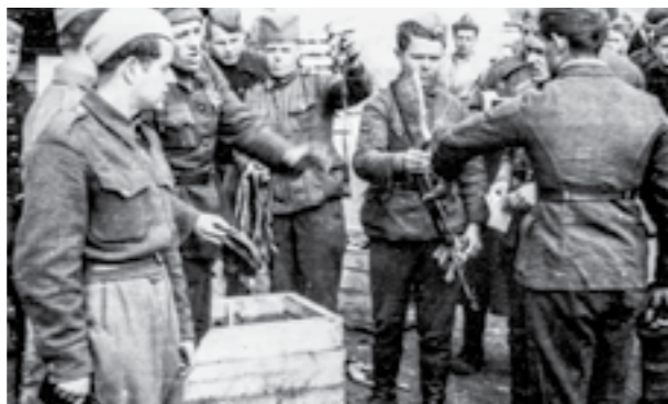
Борците на 14-та бригада добиваат оружје во Батајница

зависела судбината на самата Германија, а со тоа и на режимот на Адолф Хитлер и Вермахтот.