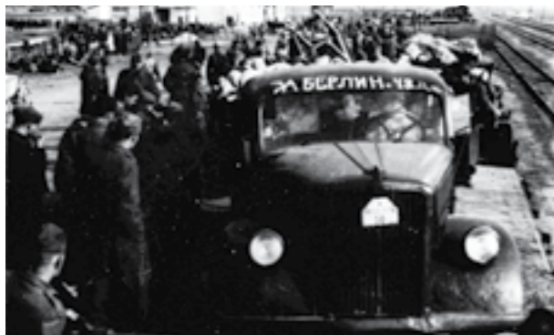
Борци на 15-от македонски корпус, 48 дивизија, поминуваат низ Батајница на пат за Сремскиот фронт