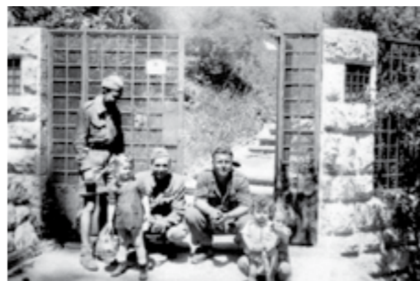
Борци на артилериската бригада, 48 дивизија, во Загреб. Мај 1945 година