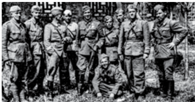
Командантот и политичкиот комесар со група старешини на Седмата (албанска) бригада, која учествувала на Сремскиот фронт