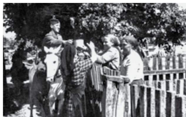
Пречек на ослободителите во Винковци