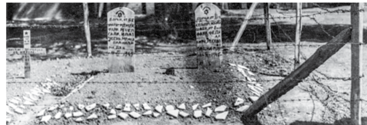
Грбови на загинали борци во завршните операции за ослободување на Југославија