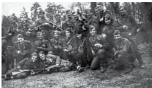
Борци на Третата македонска бригада, 42 дивизија, на воена обука во Земун пред заминување на Сремскиот фронт