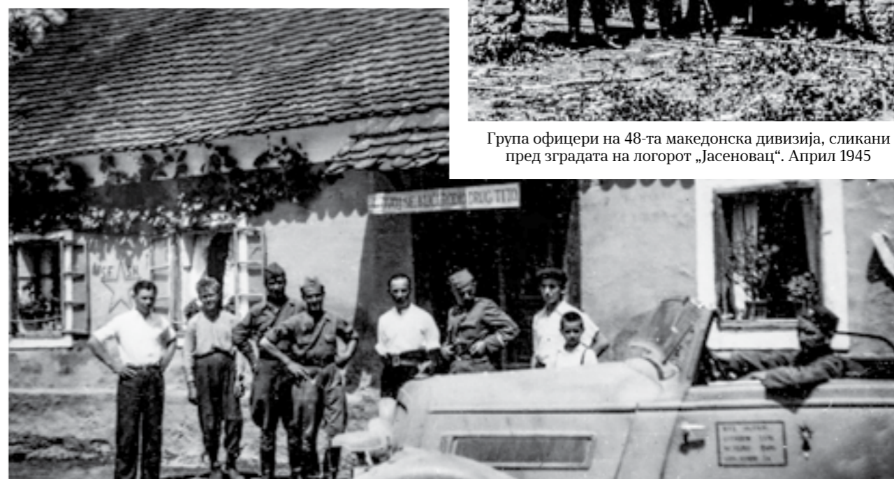
Група офицери на 48-та македонска ударна дивизија, пред родната куќа на Јосип Броз Тито во Кумровец. Мај 1945