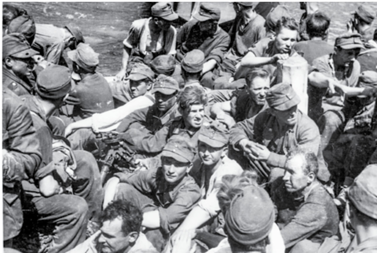
Заробени германски војници на бродови се пренесуваат во заробенички логор на островот Вис. Јуни 1945 година