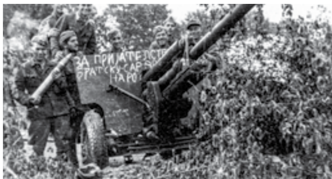
Артилериска единица на Сремскиот фронт. Април 1945 година