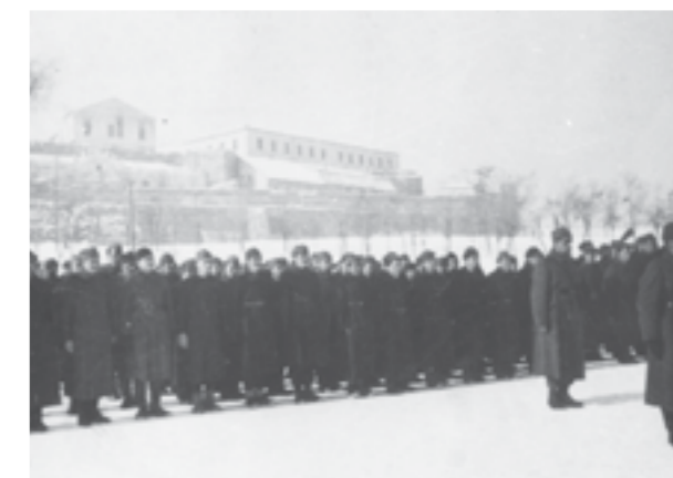
Смотра на борците на Четвртата бригада пред касарните во Скопје, пред заминувањето на Сремскиот фронт. Јануари 1945