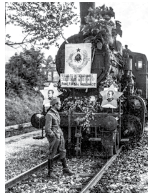
Композицијата со која патуваа борците на 42-та дивизија на пат за Македонија, по завршените операции на Сремскиот фронт