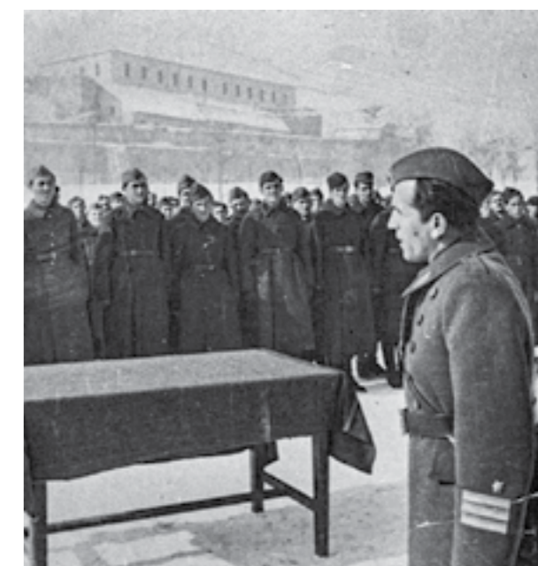
Припадниците на 48-та дивизија, Втората артилериска бригада, Првата батерија, полагаат заклетва пред старешините пред заминувањето на Сремскиот фронт. Пред борците зборува командантот на Главниот штаб на НОВ на Македонија, генералот Михајло Апостолски