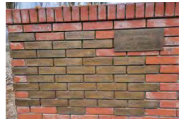
Имиња на загинати борци во состав на македонските единици, поставени во Алејата на честа во меморијалниот комплекс „Сремски фронт“

(генерал-полковник Тодор Аџанасовски. На Сремскиот фронт, волинички комесар на 14-та младинска бригада „Димитар Влахов“)