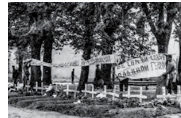
Грбови на загинали борци во борбите кај Врпоље. 17 април 1945 година