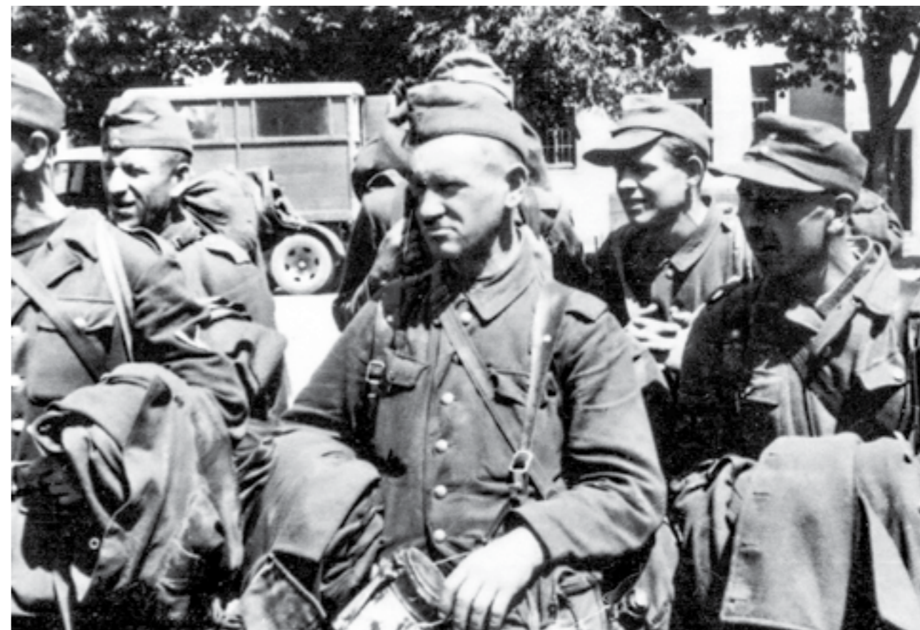
Заробени германски војници на Сремски фронт. Мај 1945 година