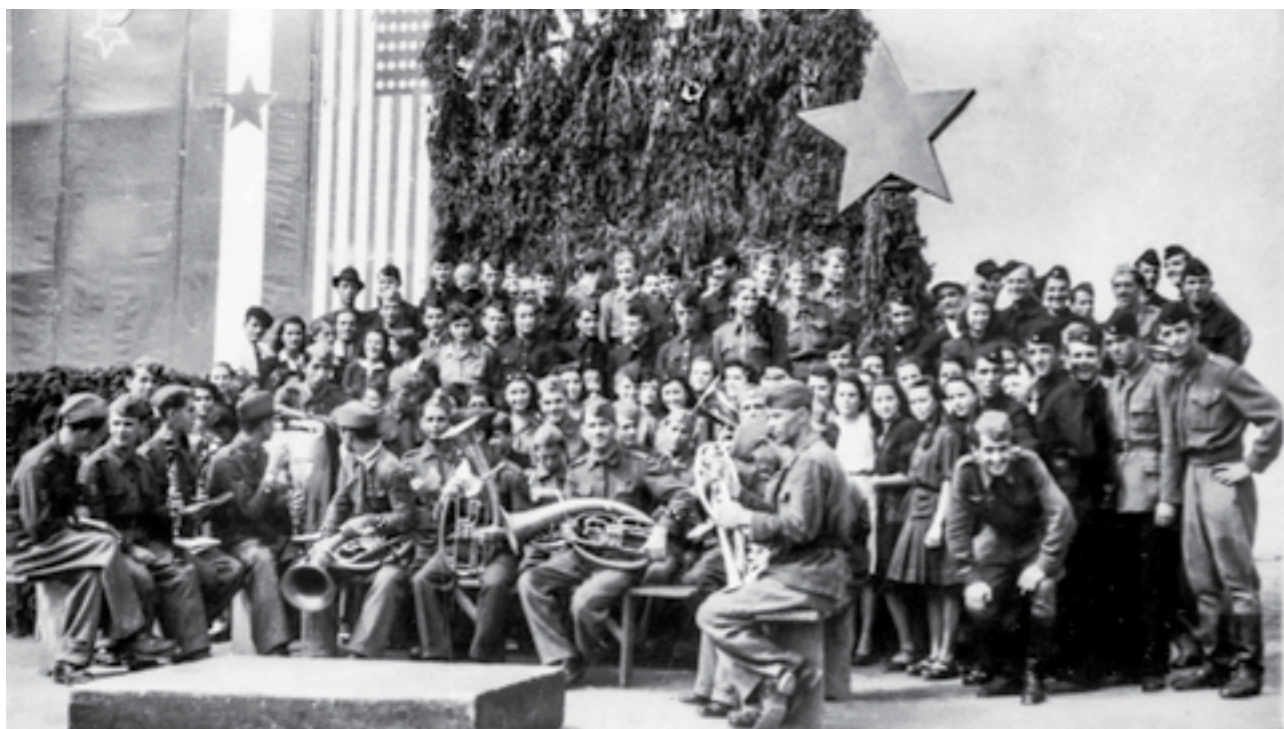
Хорот и воената музика на 48-та македонска ударна дивизија во Штип. Јуни 1945 година