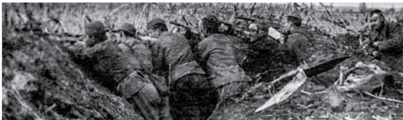
Во рововите на Сремскиот фронт. Април 1945 година