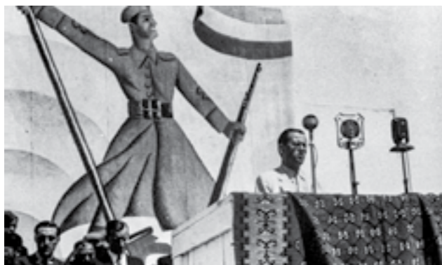
Комесарот на 48-та дивизија зборува на големиот митинг во Скопје, по победата на Сремскиот фронт