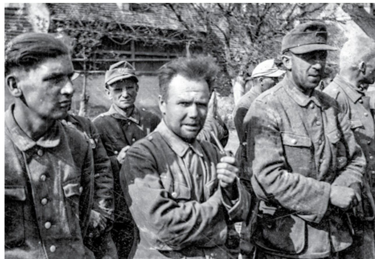
Заробени Германци на Сремскиот фронт