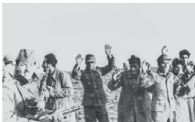
Заробени германски војници во завршните операции за ослободување на Југославија