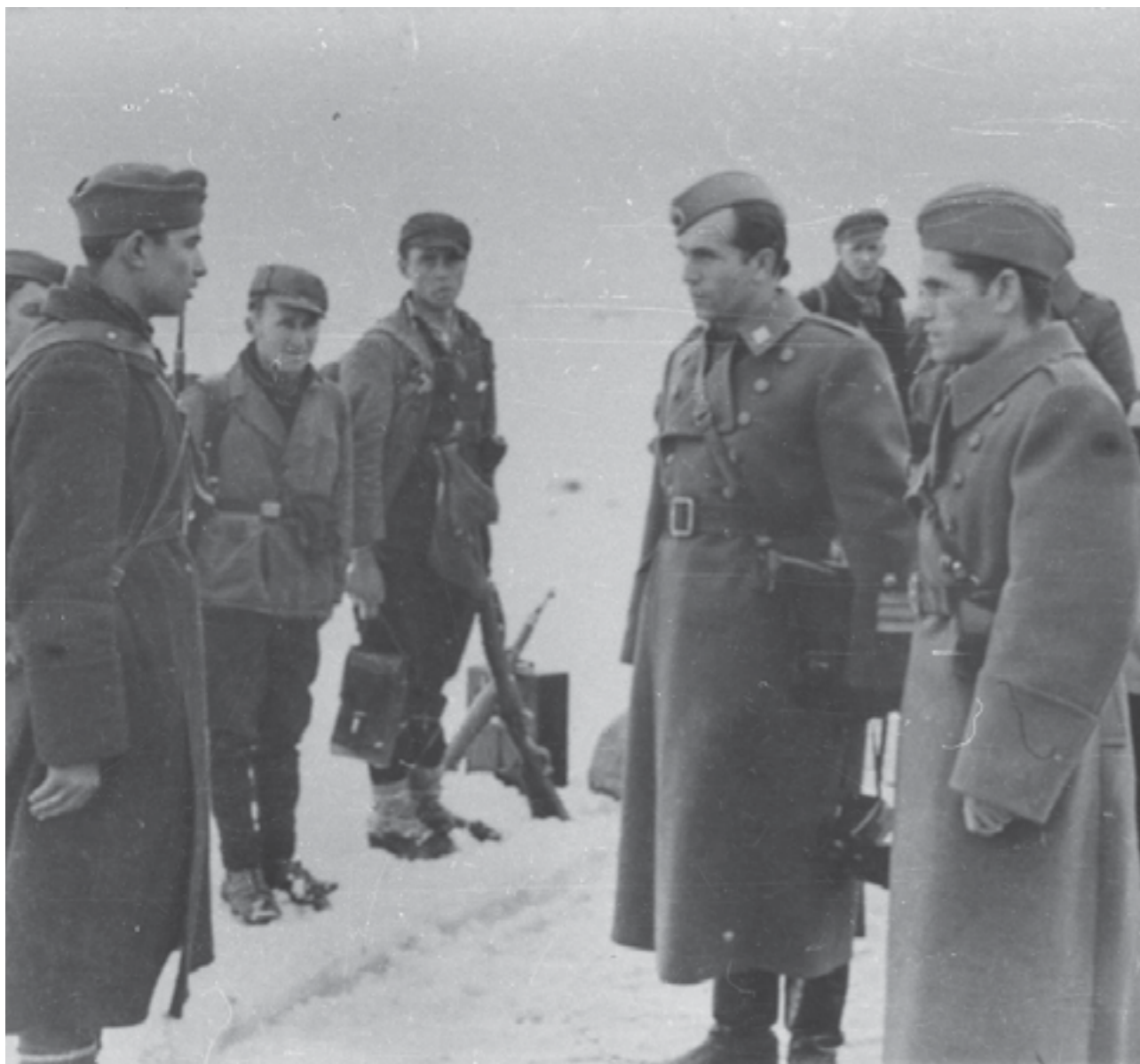
Командантот на Главниот штаб на Македонија, Михајло Апостолски, комесарот Борко Темелковски – Лилјакот, во обиколка на единиците од 15-от македонски корпус на патот Скопје – Куманово, пред нивното заминување на Сремскиот фронт. Јануари 1945 година

офанзива на фронтите, со која требало да ѝ се зададе завршниот удар на нацистичка Германија и на нејзините сојузници. Од успехот на оваа операција зависела победата над фашизмот, а со тоа и крајот на војната. Во такви околности, секаква друга ориентација и одлука на македонското раководство и воените сили однапред била осудена на пропаст и директно би ги загрозила придобивките од национално-ослободителната и антифашистичка војна во Македонија.