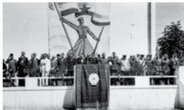
Претставници на воената и цивилната власт и членови на советската воена мисија на почесната трибина во Скопје, при пречекот на борците од 48-та дивизија. Јуни 1945