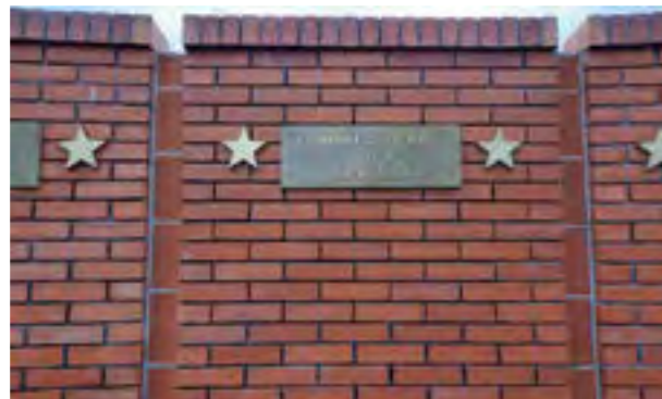
Имиња на македонски единици учеснички на Сремскиот фронт, како дел од меморијалниот комплекс „Сремски фронт“