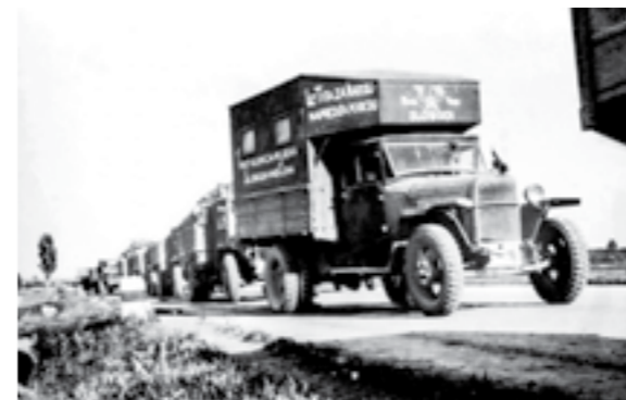
Подвижни работилници за поправка на тенкови на 48-та македонска ударна бригада. Мај 1945