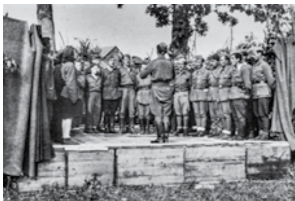
Хорот на 48-та дивизија на Сремскиот фронт