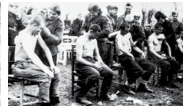
Практична обука на санитетскиот ред за време на пролетната офанзива