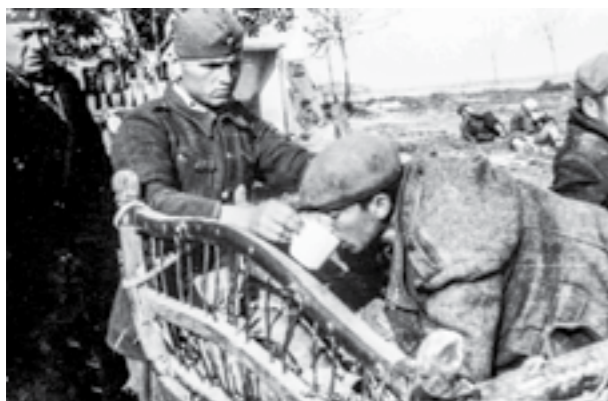
Ранети борци пред Славонска Пожега. Април 1945