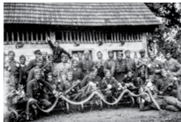
Митралесци на Втората македонска бригада по борбите кај Банова Јаруга. Мај 1945