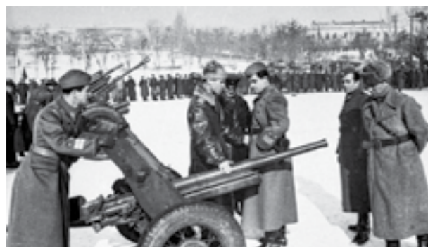
Виши воени офицери, советски инструктори и борци на 15-от корпус пред скопските касарни, во подготовки на корпусот за Сремскиот фронт. 1 јануари 1945 година