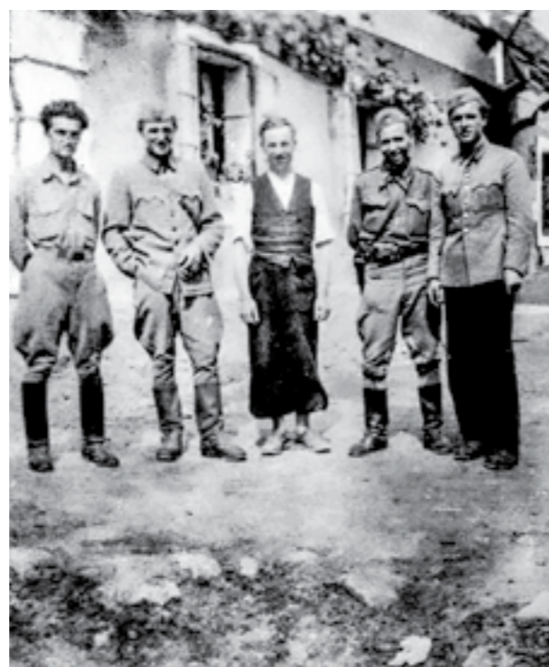
Борци на артилериската бригада, 48 дивизија, пред куќата на еден селанец, пред нападот Стрижиовјо-Врпоље. Април 1945

Истовремено, интеракцијата и блиските односи со цивилното население биле од особена важност за новите власти, на што се посветувало и посебно внимание. Така, ретките моменти на затишје од воените дејствија, борците ги користеле за одмор, релаксација и дружење со локалното население. Тоа вклучувало и организирање разни манифестации: агитациско-пропагандни, музички, спортски и други активности, во кои свое учество земало и локалното цивилно население.