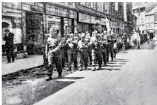
Воената музика на 42-та дивизија во слободен Загреб