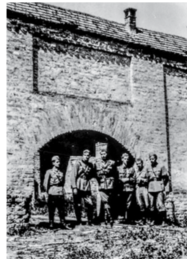
Група офицери на 48-та македонска дивизија, снимани пред зградата на логорот „Јасеновац“. Април 1945