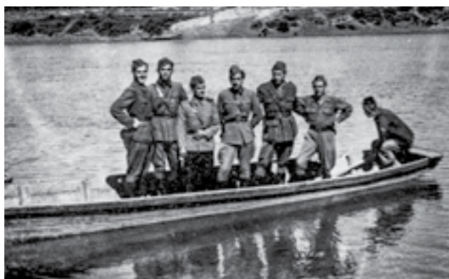
Официри на 48-та македонска ударна бригада, на реката Врбас, на пат за Македонија. Јуни 1945