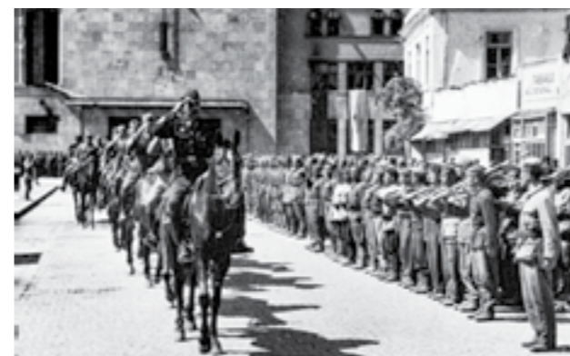
Пречек на борците од 48-та дивизија во Скопје, по победата на Сремскиот фронт. 15 јуни 1945