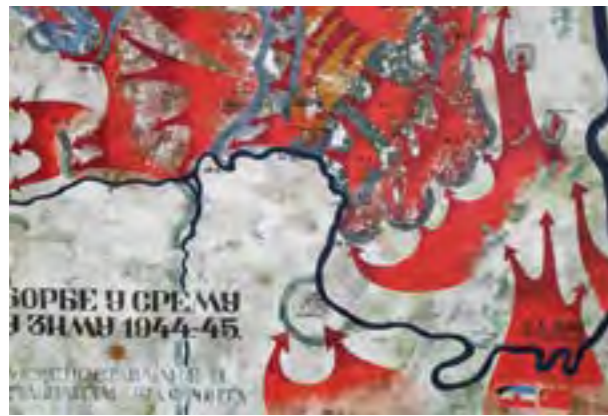
Приказ на изгледот на фронталната линија на Сремскиот фронт во зимата 1945 година, непосредно пред доаѓањето на македонските единици