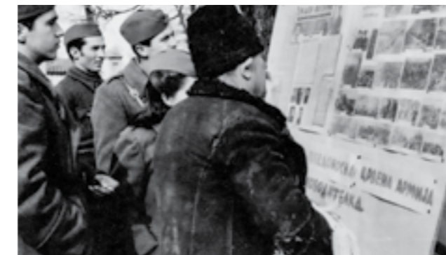
Сиден весник на 48-та македонска ударна дивизија во Батајница

повлекле од Срем во Унгарија. Кратко потоа биле повлечени и бугарските единици. На тој начин, главниот товар на Сремскиот фронт останал на единиците на југословенската војска. Притоа, крајната цел на Тито и на југословенското воено-политичко раководство била јасна: ослободување, со сопствени сили, на целата територија на земјата и истовремено ликвидирање на сите колаборационистички и непријателски елементи.