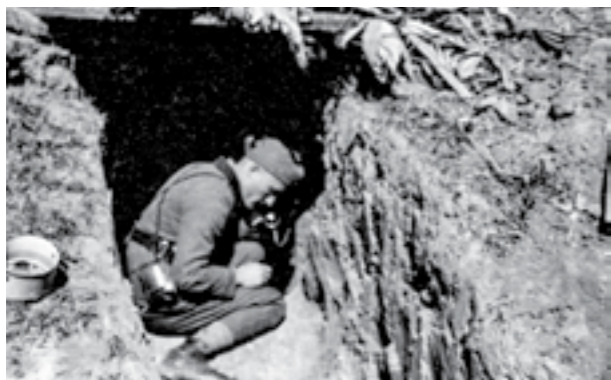
Во рововите на Сремскиот фронт