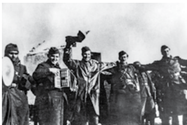
Раководители и борци на Првата македонска ударна бригада се забавуваат во часовите на одмор

мија за чистење на теренот од сите непријателски елементи.