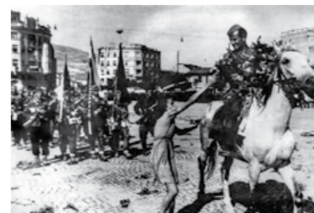
Величествен пречек на борците од 48-та македонска дивизија во Скопје, по победата на Сремскиот фронт. 15 јуни 1945