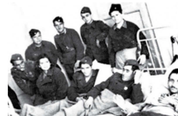
Ранети борци на лекување во болницата на Сремскиот фронт, 1945 година

Она што може да се тврди со поголема сигурност е дека најголемиот број жртви меѓу македонските борци паднале за време на самиот пробив на фронтот, поточно, во деновите непосредно по 12 април 1945 година. Преживеаните борци се сеќаваат на овие денови како на најтешките во целокупната кампања, кога биле водени најжестоките борби и дадени најголемите жртви. Некои од нив состојбата на Фронтот ја опишуваат како вистинска касапница, во која партизаните буквално биле покосени. Според тврдењата, само во борбите водени на 12 април 1945 година, македонските единици имале приближно 150 мртви и над 450 ранети борци. Три дена подоцна, на 15 април, во борбите кај Будровац, близу Ѓаково, загинале 210 борци. Многу тешки борби, со голем број мртви и ранети имало и кај Шид, Врпоље, Славонска Пожега и на многу други места.