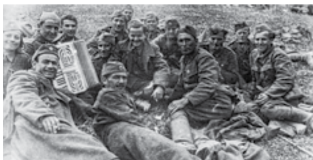
Раководители и борци на Првата македонска ударна бригада, 48 дивизија, на Сремскиот фронт. Април 1945