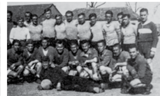
Фудбалскиот тим на 42-та дивизија во Земун. Март 1945 година