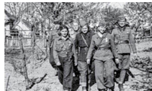
Борци на 16-та бригада, 42 дивизија, на Сремскиот фронт