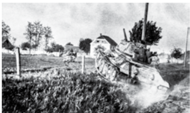
Тенковска единица во акција на Сремскиот фронт