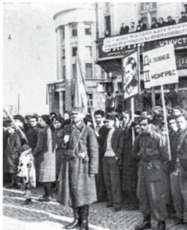
Митинг во Скопје по повод одржувањето на Вториот конгрес на Народноослободителниот младински сојуз на Македонија (НОМСМ)