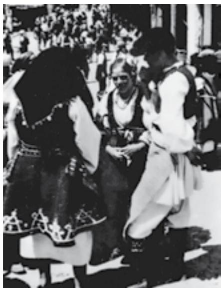
Селани од Штипско за време на пречекот на 48-та дивизија. Јуни 1945