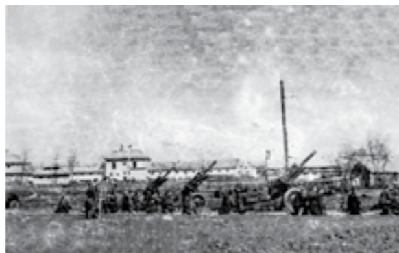
Артилериска батерија на Сремскиот фронт