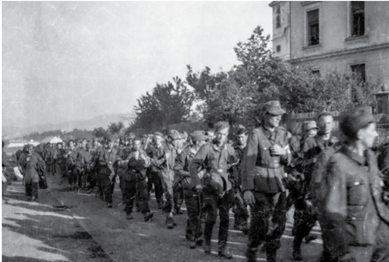
Колона заробени германски војници на Сремскиот фронт