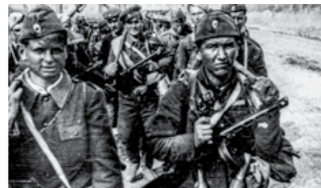
Борци на Втората македонска ударна бригада на Сремскиот фронт