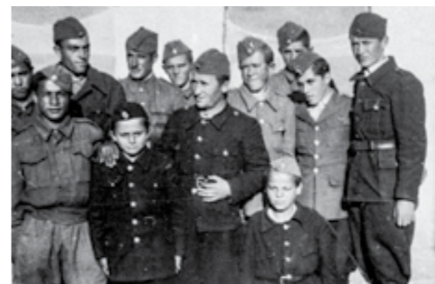
Деца од Босна, воени сирачиња, кои ги издржувала 48-та македонска ударна дивизија. Јуни 1945 година