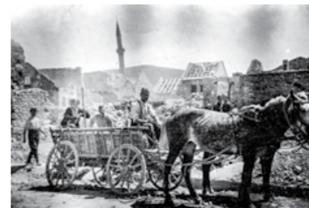
Босански Петровац во рушевини. Мај 1945 година