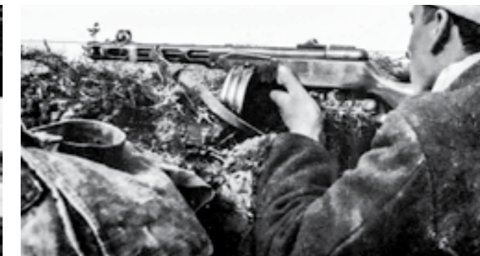
Борец на Првата македонска ударна бригада на позиции кај Стрижиовојно