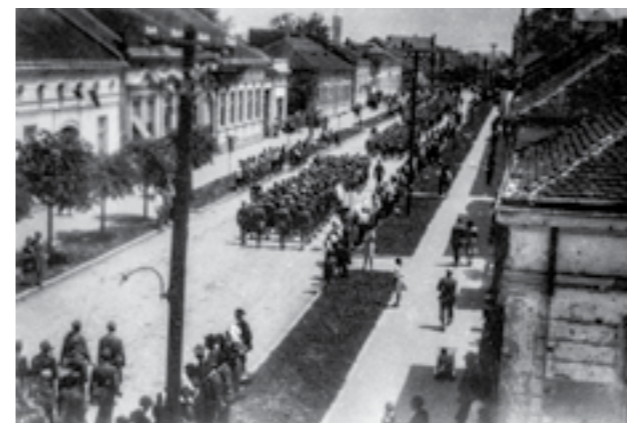
Втората артилериска бригада на парада во Ваљево по враќањето од Сремскиот фронт, на пат кон Македонија. Јуни 1945 година