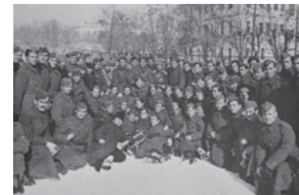
Борците од 48-та дивизија, Втората артилериска бригада, Првиот дивизион, Првиот баталјон, во касарната во Скопје. Јануари 1945

Барањето на војниците за одење на Солун било повеќе емотивно, отколку реално. Одлуката за испраќање на своите единици на Сремскиот фронт, македонското политичко и воено раководство ја донесло во тесна координација и по налог на југословенското врховно водство, на чело со Јосип Броз Тито. Ваквата одлука била во согласност со реалните и објективни состојби на теренот и со југословенскиот државен интерес за ослободување на останатиот дел од земјата. Уште повеќе, ваквата одлука била во согласност и со стратешката ориентација на силите на антифашистичката коалиција, САД, СССР и Велика Британија. Имено, во тоа време, под паролата „Сите на Берлин“, коалицијата забрзано се подготвувала за последната голема