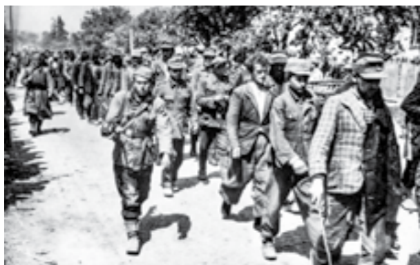
Заробени усташа од борците на македонските единици на Сремскиот фронт. Мај 1945 година