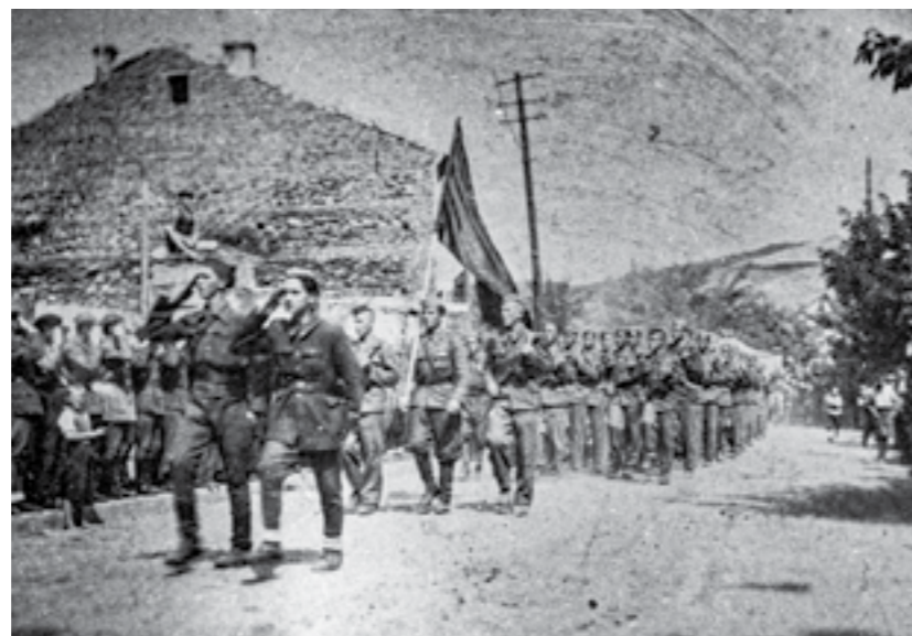
Дефиле на борците од 14-та бригада во Кочани, по враќањето од Сремскиот фронт. Јуни 1945