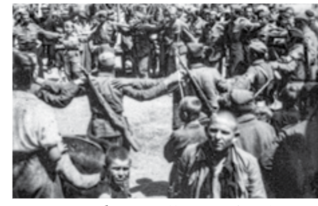
Пречек на борците од 48-та дивизија во Горни Обрежац, Словенија. Мај 1945 година