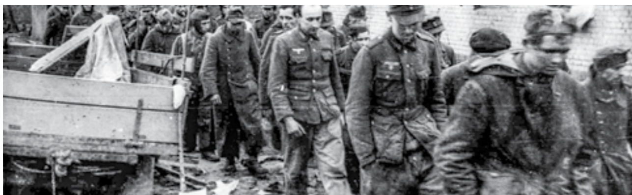
Колона заробени германски војници на Сремскиот фронт

Крајот на борбените дејствија истовремено го означил и крајот на граѓанската војна во Југославија, која се водела меѓу различните националистички и профашистички елементи, од една страна, наспроти силите на народноослободителната и антифашистичка војска, предводена од Комунистичката партија на Југославија, од другата страна.