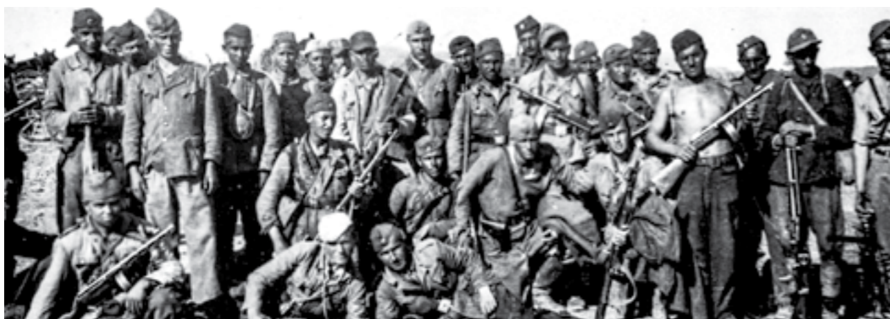
Борци на 48-та македонска ударна дивизија на Сремскиот фронт