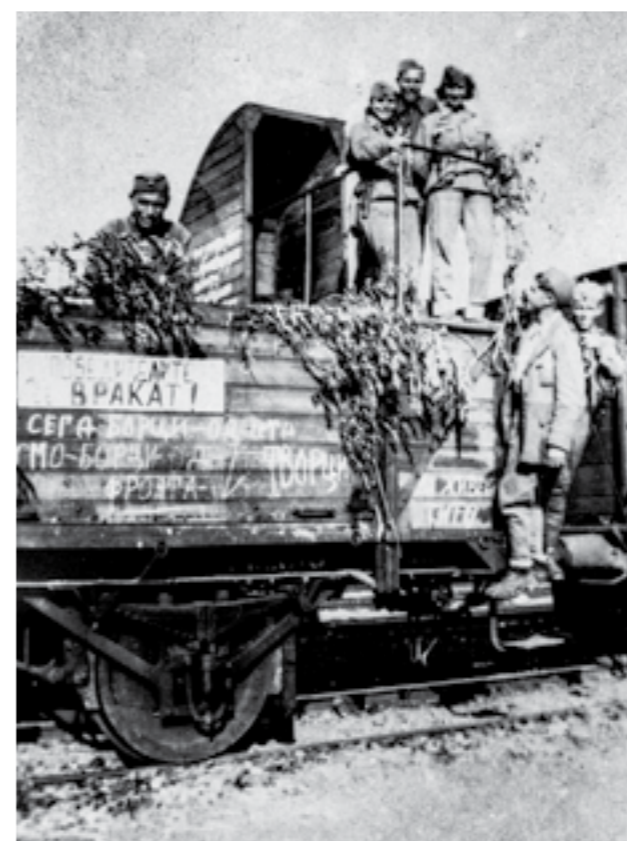
Борци од 48-та дивизија по враќањето од Сремскиот фронт