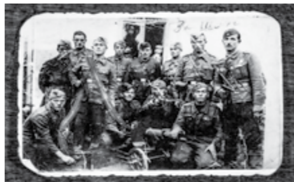
Група борци на Седмата (албанска) бригада, 42 дивизија, на Сремскиот фронт