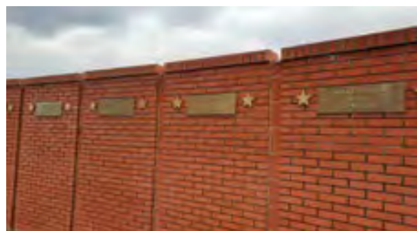
Имиња на македонски единици - учеснички на Сремскиот фронт, испишани на плочки, поставени на вертикални подзидоци, дел од меморијалниот комплекс „Сремски фронт“