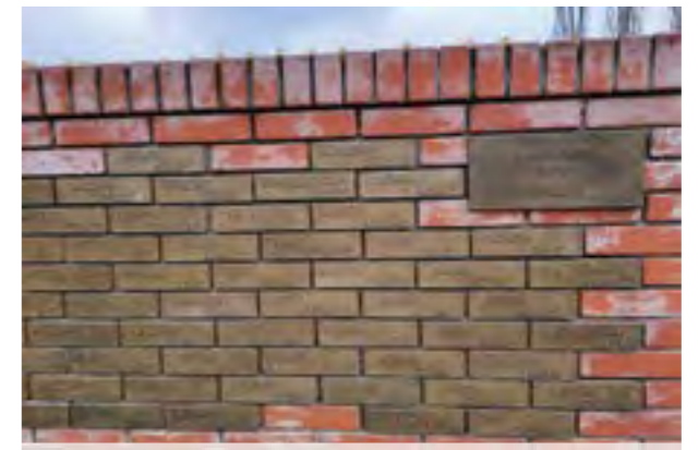
Имиња на загинати борци во состав на македонските единици, поставени во Алејата на честа во меморијалниот комплекс „Сремски фронт“