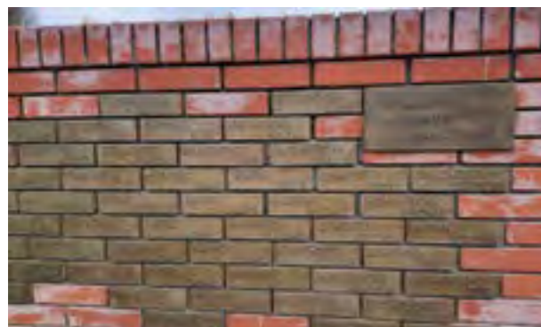
Имиња на загинати борци во состав на македонските единици, поставени во Алејата на честа во меморијалниот комплекс „Сремски фронт“