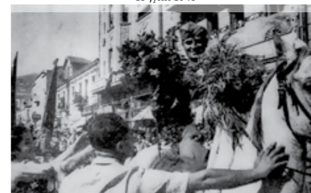
Величествен пречек на борците од 48-та дивизија во Скопје, по победата на Сремскиот фронт. 15 јуни 1945