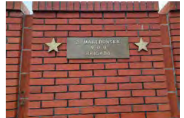
Имиња на македонски единици учеснички на Сремскиот фронт, дел од меморијалниот комплекс „Сремски фронт“