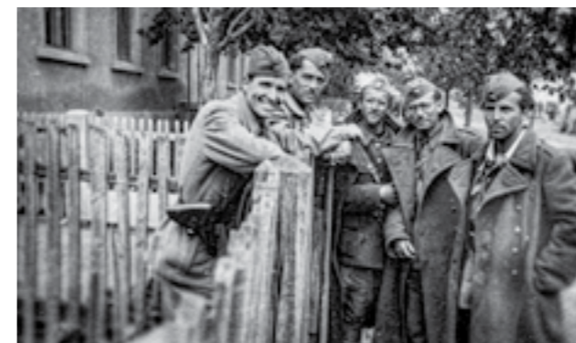
Членовите на штабот на Првата македонска ударна бригада