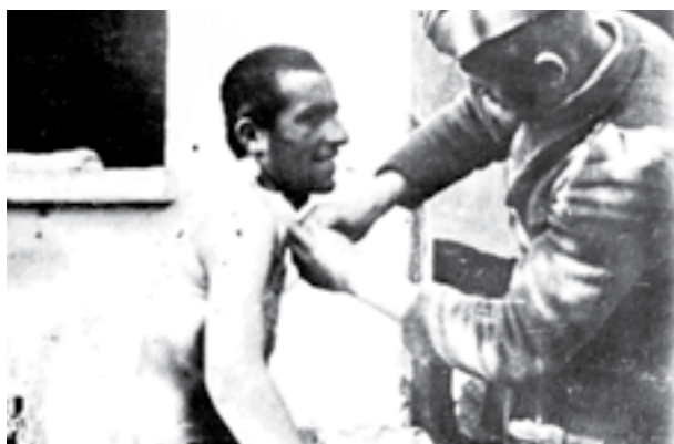
Преврзување ранети борци на Сремскиот фронт

тот, биле претежно многу млади и штотуку регрутирани. Тие немале доволно време за квалитетна подготовка и воена обука. Обуката честопати траела само неколку денови и во многу лоши (зимски) услови, по што веднаш биле испраќани на фронтот, неподготвени и ненавикнати на новиот тип на војување. Истото се однесува и за поголемиот дел од командниот кадар, кој претходно се прославил во партизанската борба, но за кого ова, исто така, претставувало нешто ново и сосема поинакво искуство. Сето тоа, како и фактот дека Титовата армија истовремено морала да се бори и со домашните непријатели (ушташи, четници и останати), довело до тоа последиците од воените дејствија на Сремскиот фронт да бидат многу тешки и да се чувствуваат со генерации подоцна.