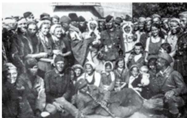
Културно-просветна приредба на Сремскиот фронт, село Јаруга, по борбите кај Славонска Пожега