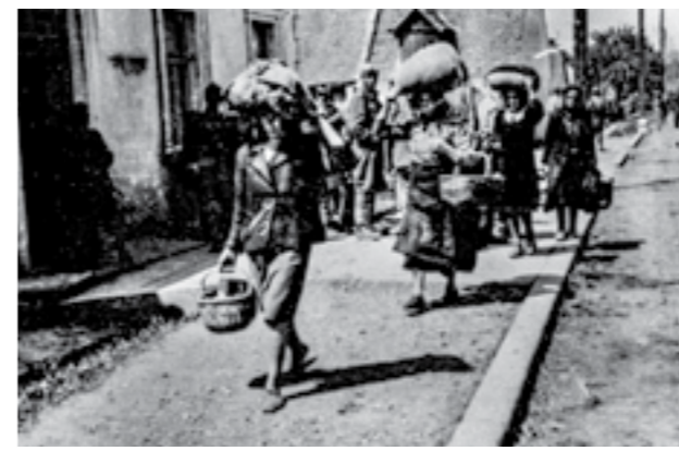
Избегани селани се враќаат во Дуго Село – Загреб. Мај 1945 година