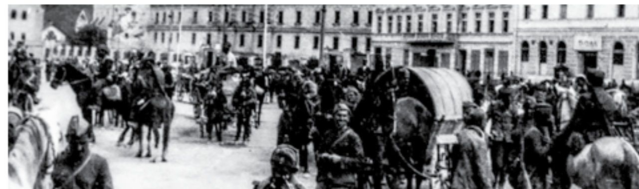
Борци на македонските бригади во ослободена Славонска Пожега. Април 1945