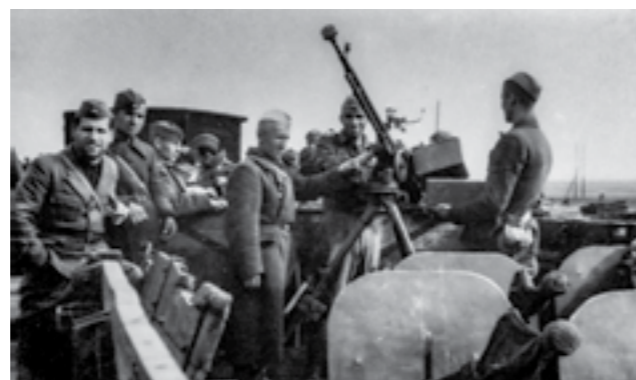
Приштапска чета при 48-та македонска дивизија