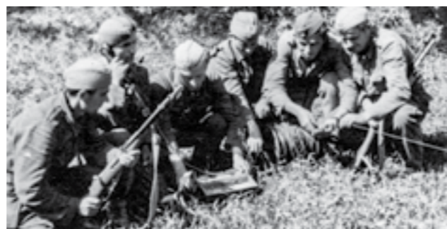
Борци на 48-та дивизија воспоставуваат врски на Сремскиот фронт. Април - мај 1945