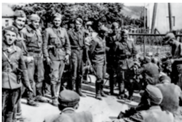
Припадници на Втората артилериска бригада, меѓу кои командантот и комесарот на бригадата, стојат пред заробени германски војници кај Загреб. Мај 1945 год