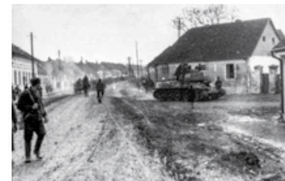
Тенковска единица пред Винковци