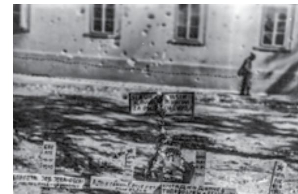
Грбови на загинали борци од македонските бригади на Сремскиот фронт