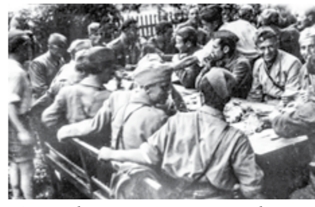
Банкет на борците од Шестата македонска бригада во с. Лесично, Словенија, по уништувањето на усташите на планината Бохор