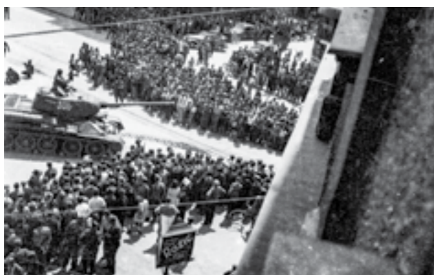
Дефиле на единиците на Првата и Втората југословенска армија во слободен Загреб