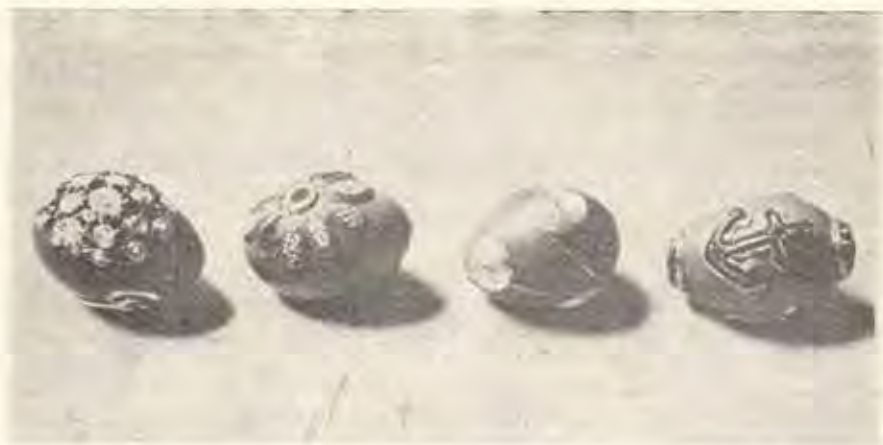
Сл. 6. Јајца украсени со срма и монистра, Скопје Oeufs ornés de fil d'or et de perles, Skopje

во текот на годината. Со „првакот“ луѓето, како и добитокот, се „чуваат“, претпазуваат и лекуваат од некои болести, а се употребува и како средство за заштита од град. Така на пример, обичај е на Велика сабота да се бањаат децата со здравец, дебелика и „првак“. Здравецот се става во водата децата да бидат здрави, дебеликата — да бидат дебели а „првакот“ — црвеното јајце — бели и црвени. По бањањето, додека е детето уште во вода, мајката го зема јајцето, го облазува по лицето и телото и вели: „Црвено-бело, здраво-живо, и у година да си дочекаш со здравје“. Потоа, кога е сè готово, јајцето пак се става пред икона за да се најде и другпат штом потреба.