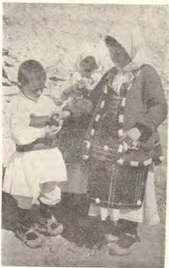
Сл. 7. Кршење со велигденски јајца, с. Драчево, Скопско Cassage des œufs de Pâques, village Dratchévo, région de Skopje

Освен на Велигден и Гурѓовден, јајца се бојадисуваат и вечерта спроти Дуовден, бидејќи на овој ден исто така се раздават на гробишта црвени јајца за „душа на умрените“. 14)