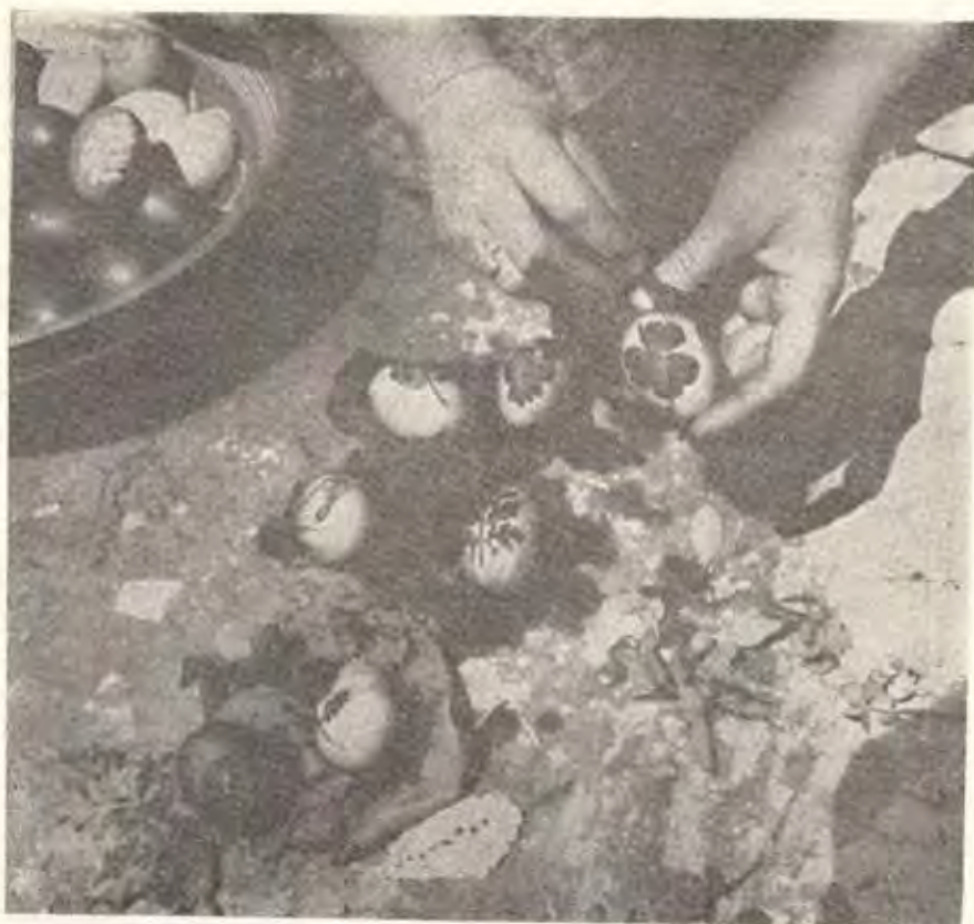
Сл. 4. Шарање јајца со лисја — детаљ од изведувањето, Скопје Décoration des oeufs avec des feuilles-détail de l'exécution, Skopje

ника води потекло од поново време и е застапен, а првенствено во градот. Претполагам дека овој начин на шарање потекнува од Тетово, зашто некои илмиња во шарките на јајцето всушност носат називи на одделни детали од тетовската градска носија. На пример, „јуркмачи“ (деталј од чинтијани, црт. 17). Кога точно оваа техника е пренесена во Скопје — не можам да наведам конкретни податоци, но сум ја сретнала во неколку куќи во градот каде што ми рекле дека ја применуваат повеќе од 40 години.