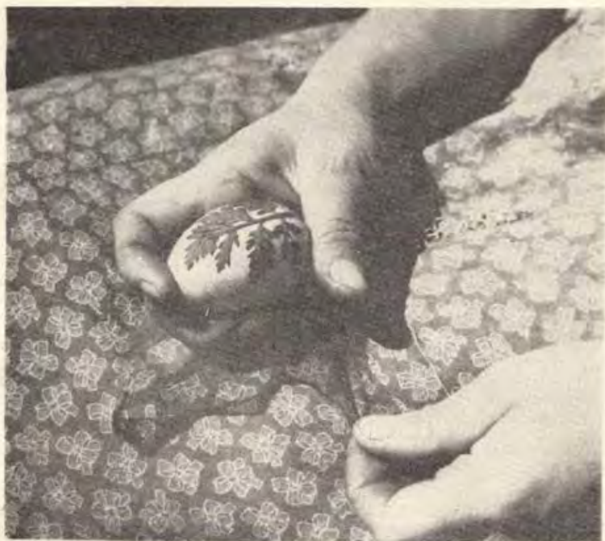
Сл. 2 Шарање јајца со лисја — детал од изведувањето, Скопје Décoration des oeufs avec des feuilles-détail de l'exécution, Skopie

Мотивите употребени при шарањето со восок се доста различни, но најчесто се земаат разни растителни орнаменти, цвеќиња, цвет од тутун, сончоглед, полско цвеќе (црт. 9), преша со лисја (црт. 10), потоа разни фигури на животни и птици, обично пиленца (црт. 11), разни геометриски орнаменти — точки, крст и сл. (црт. 12). Понекогаш јајцата се шараат и на тој начин што се впишува на нив името на селото каде што ги шарале (на пр. с. Горно Лисиче). Има случаи кога на јајцата пишуваат и лични имиња: често девојките го ставаат своето име на она јајце што за Велигден ќе го подарат на својот сакан 7) , на пример „Успомен од Љуба (црт. 13). Но најмногу се среќава честитката „Христос Воскресе“, во знак на празникот 8) (црт. 14).