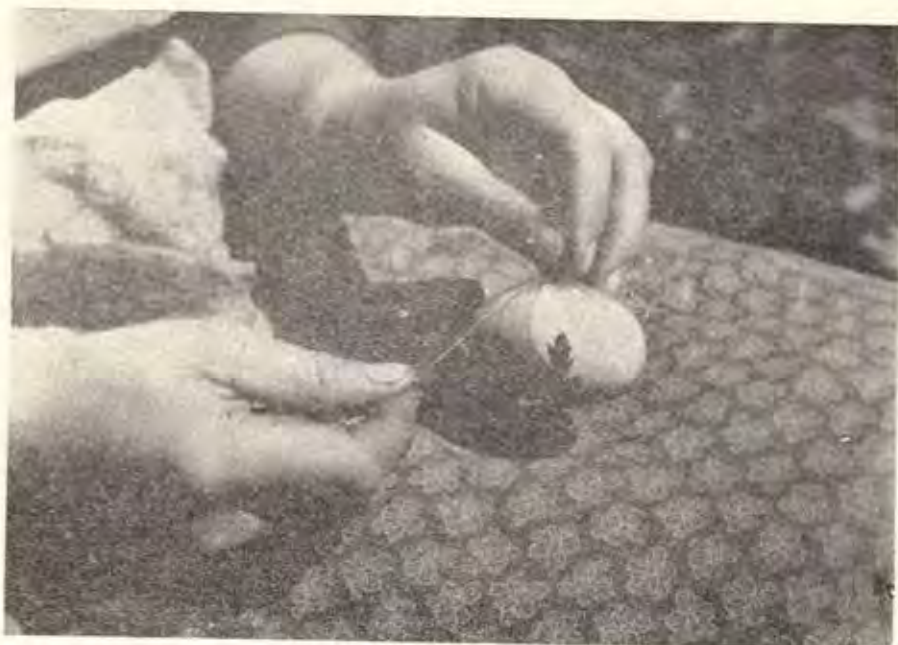
Сл. 3 Шарање јајца со лисја — детал од изведувањето, Скопје Décoration des oeufs avec des feuilles-détail de l'exécution, Skoplé

Шарање црвени јајца со „кезап“ ( \text{HNO}_2 — азотна киселина). Пред да се шараат јајцата со „кезап“, треба да бидат веќе бојадисани со една боја, обично црвена. Потоа, по така бојадисаното јајце се шара со сламка, или со некое парче дрво заострено на врвот. „Кезапот“ се става во мало шишенце или чаша каде што се мака со сламката. Шарка се добива на тој начин што оваа течност ја растворува бојата на јајцето и таму кај што поминала сламката остануваат бели траги. Додека трае шарањето неколку дрвца или сламки треба да се заменат, бидејќи киселината ги разјадува. Ишараните јајца на крајот се бришат со крпа за да светнат.